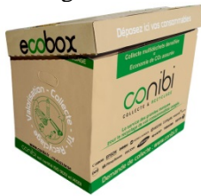
ECOBX 100 litres 45 cm X 60 cm X 40 cm

Dès la première collecte (*), nous vous livrons des contenants adaptés pour regrouper vos consommables usagés :